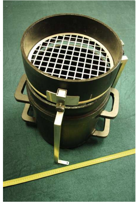
그림 2. 작동상태

는 작고 옮기는 것이 용이합니다. 휴대용 상태로 바꾸면 샘플용기로서도 사용할 수 있습니다. 계기의 앞부분은 뚜껑이 닫힐 수 있습니다. 휴대용 상태에 있는 계기는 모든 기본 장비와 부속품에 잘 맞습니다.