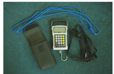
그림 5. 디지털 스케일 눈금

기본 세트의 부품은 제 1 표에 표시되어 있습니다. 측정용 세트는 스탠드 기둥의 고정용 부속 플라스틱 볼트의 2 개를 포함합니다. 플라스틱 솔은 토탄을 포장전의 상태로 하기 위하여 사용됩니다. 솔을 사용하여 토탄 브리케트 표면에서 토탄을 쓸어버리고 토탄의 분자를 분리합니다.