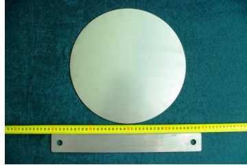
İ 4.Kapak ve nivo (nivelman) bıçak