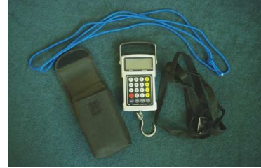
İ 5. Dijital terazi iskalası

Setin önemli bileşenleri cetvel 1 de sayılıyor.Olçü setine, duyarlı (hassas) stantın dayacağını saptamak için 2 tane plastik başlı plastik cıvata aittir. Ölçü setinde plastik kıllı fırça turbanın paketlemeden önceki orijinal durumunu yapmak için kullanılıyor. Fırçalar turbanı turba briketinden süpürüyor ve hemde küçük turba parçalarını birbirinden ayırıyor.