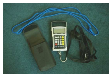
ábra 5. Digitális karos mérleg

A mérőberendezés tartozékait az 1. táblázat tartalmazza. A berendezéshez 2 műanyag csavar is tartozik, amelyek a precíziós állvány rögzítésére szolgálnak. A műanyag sörtéjű kefével szétválaszthatók az összeállt tőzegdarabok csomagolás előtt. A kefe arra is alkalmas, hogy a bálás tőzeget megtisztítsa a tőzegtörmeléktől, és elegyengesse az összetapadt tőzeggzemcséket.