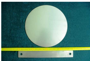
Εικόνα 4. Καπάκι και μαχαίρι