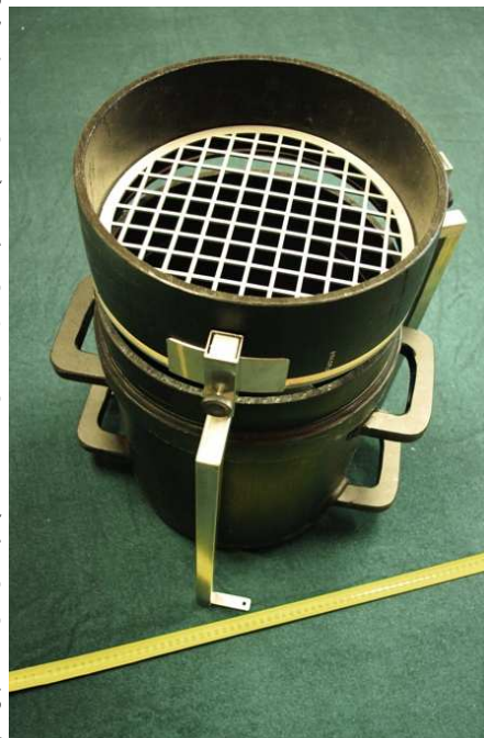
Εικόνα 2. Θέση λειτουργίας

μεταφοράς το πρότυπο μπορεί να χρησιμοποιείται ως δοχείο δειγμάτων. Το πάνω μέρος του προτύπου μπορεί να κλείνεται με καπάκι. Στη θέση μεταφοράς το πρότυπο ταιριάζει σε όλο το βασικό εξοπλισμό και τα σύνεργα. Η μετατροπή στη θέση μεταφοράς γίνεται με την περιστροφή υποστηριγμάτων της ευαίσθητης βάσης κατά 90 μοίρες. Τα μεταλλικά στοιχεία του σετ μέτρησης είναι κατασκευασμένα από οξυάνοχο ανοξείδωτο ατσάλι. Το πρότυπο, το δοχείο του προτύπου και η βάση του ηθμού είναι