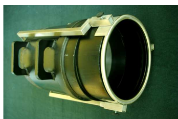
Εικόνα 1. Θέση μεταφοράς

ΤΟ ΣΕΤ "CK-1" για τον προσδιορισμό ειδικού βάρους ασυσκευαστων υλικών είναι σχεδιασμένο για τον προσδιορισμό ειδικού βάρους ασυσκευαστων υλικών σύμφωνα με το Πρότυπο EN12580 της ΕΕ. Το Πρότυπο EN12580 της ΕΕ προβλέπει τη μέθοδο για τον προσδιορισμό του αριθμού των μιγμάτων εδαφικών στρωμάτων και βελτιωτικών του εδάφους (κηπευτική τύρφη, υποστρώματα, φυτοχώματα, κομπόστες, δεντρόφλουδα κα.). Το σετ μέτρησης είναι κατασκευασμένο τσσύμφωνα εξοπλισμό μέτρησης του Προτύπου EN12580 της ΕΕ. Το πρότυπο που περιλαμβάνεται στο σετ μέτρησης είναι βαθμονομημένο, όπως δείχνει το αυτοκόλλητο στο πρότυπο και πιστοποιητικό βαθμονόμησης που συμπεριλαμβάνεται. Το σετ έχει θέση μεταφοράς και θέση λειτουργίας (βλ. εικόνα 1 και 2). Για να τοποθετήσετε το σετ στη θέση λειτουργίας και το αντίθετο χρειάζονται μόνο λίγα λεπτά. Στη θέση μεταφοράς το σετ μέτρησης καταλαμβάνει λίγο χώρο και μεταφέρεται εύκολα. Στη θέση